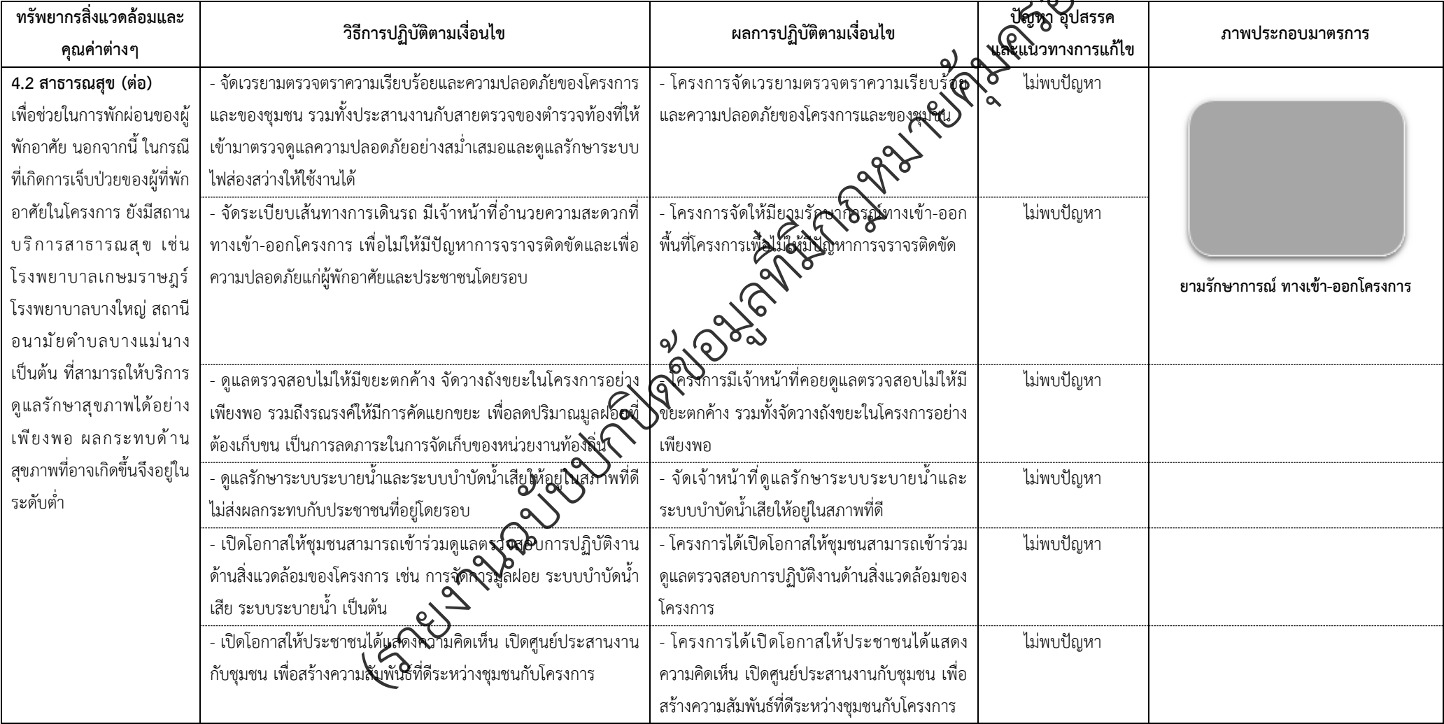
ตารางที่ 2-1 สรุปผลกระทบสิ่งแวดล้อมที่สำคัญและการปฏิบัติตามมาตรการป้องกันและแก้ไขผลกระทบสิ่งแวดล้อมและมาตรการติดตามตรวจสอบผลกระทบสิ่งแวดล้อม (ระยะดำเนินการ) โครงการเพอร์เฟค พาร์ค พระราม 5-บางใหญ่ ตั้งอยู่ที่ ตำบลบางแม่นาง อำเภอบางใหญ่ จังหวัดนนทบุรี (ต่อ)