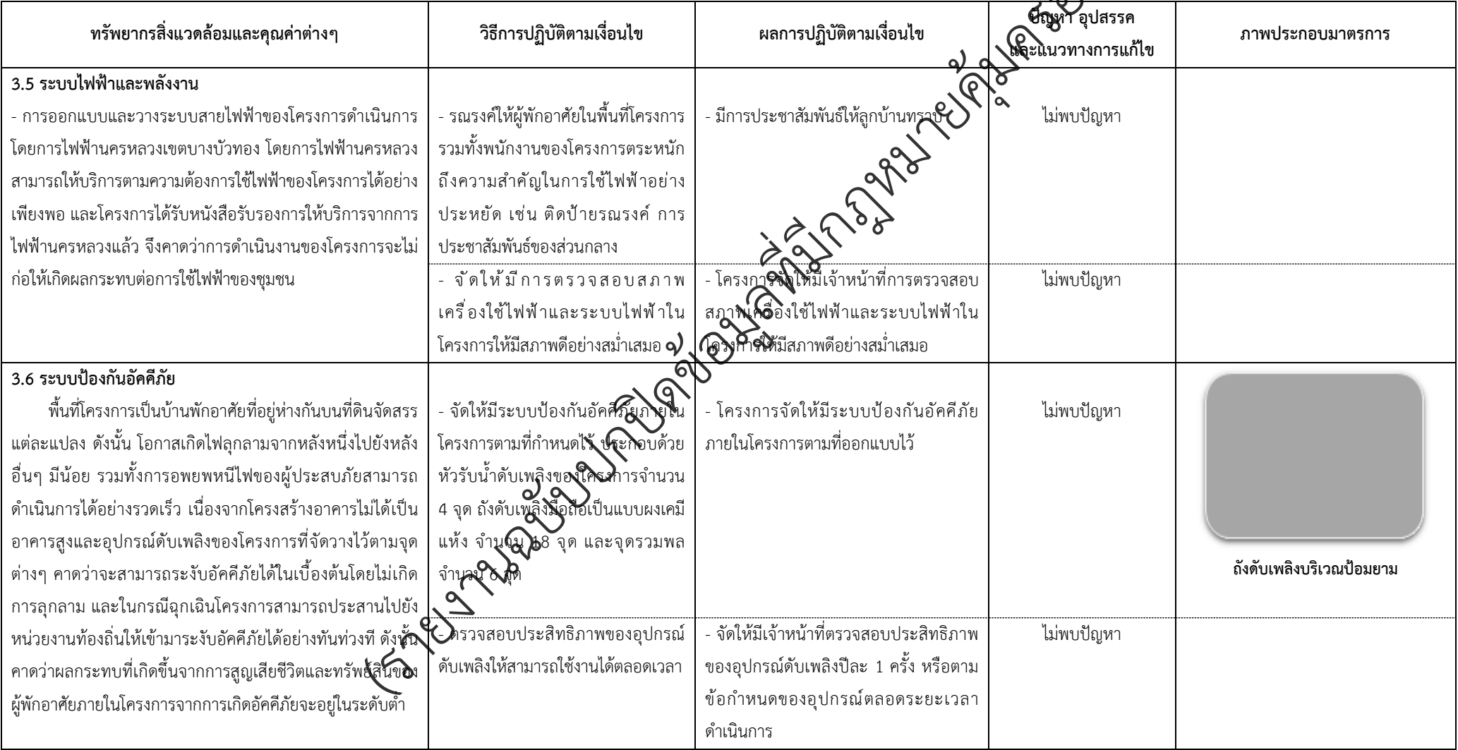
ตารางที่ 2-1 สรุปผลกระทบสิ่งแวดล้อมที่สำคัญและการปฏิบัติตามมาตรการป้องกันและแก้ไขผลกระทบสิ่งแวดล้อมและมาตรการติดตามตรวจสอบผลกระทบสิ่งแวดล้อม (ระยะดำเนินการ) โครงการเพอร์เฟค พาร์ค พระราม 5-บางใหญ่ ตั้งอยู่ที่ ตำบลบางแม่นาง อำเภอบางใหญ่ จังหวัดนนทบุรี (ต่อ)