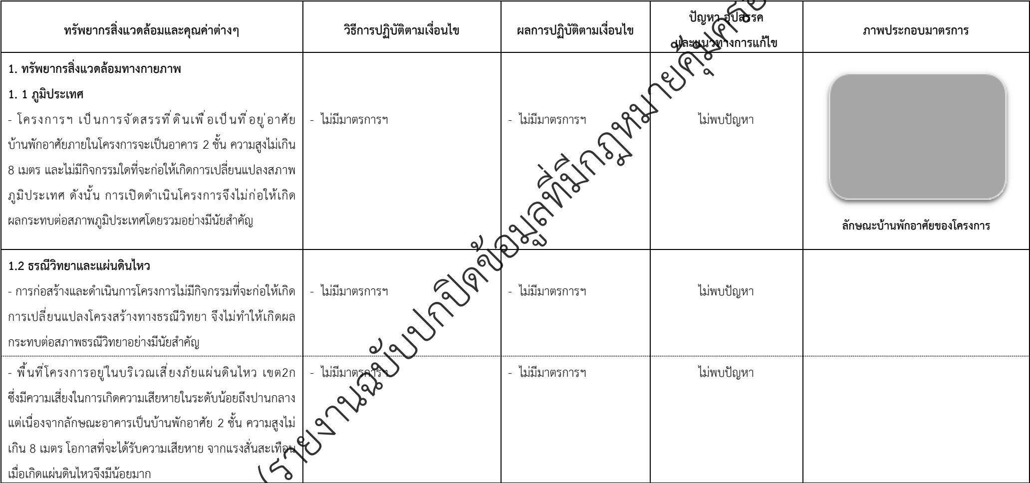
ตารางที่ 2-1 สรุปผลกระทบสิ่งแวดล้อมที่สำคัญและการปฏิบัติตามมาตรการป้องกันและแก้ไขผลกระทบสิ่งแวดล้อมและมาตรการติดตามตรวจสอบผลกระทบสิ่งแวดล้อม (ระยะดำเนินการ) โครงการเพอร์เฟค พาร์ค พระราม 5-บางใหญ่ ตั้งอยู่ที่ ตำบลบางแม่นาง อำเภอบางใหญ่ จังหวัดนนทบุรี