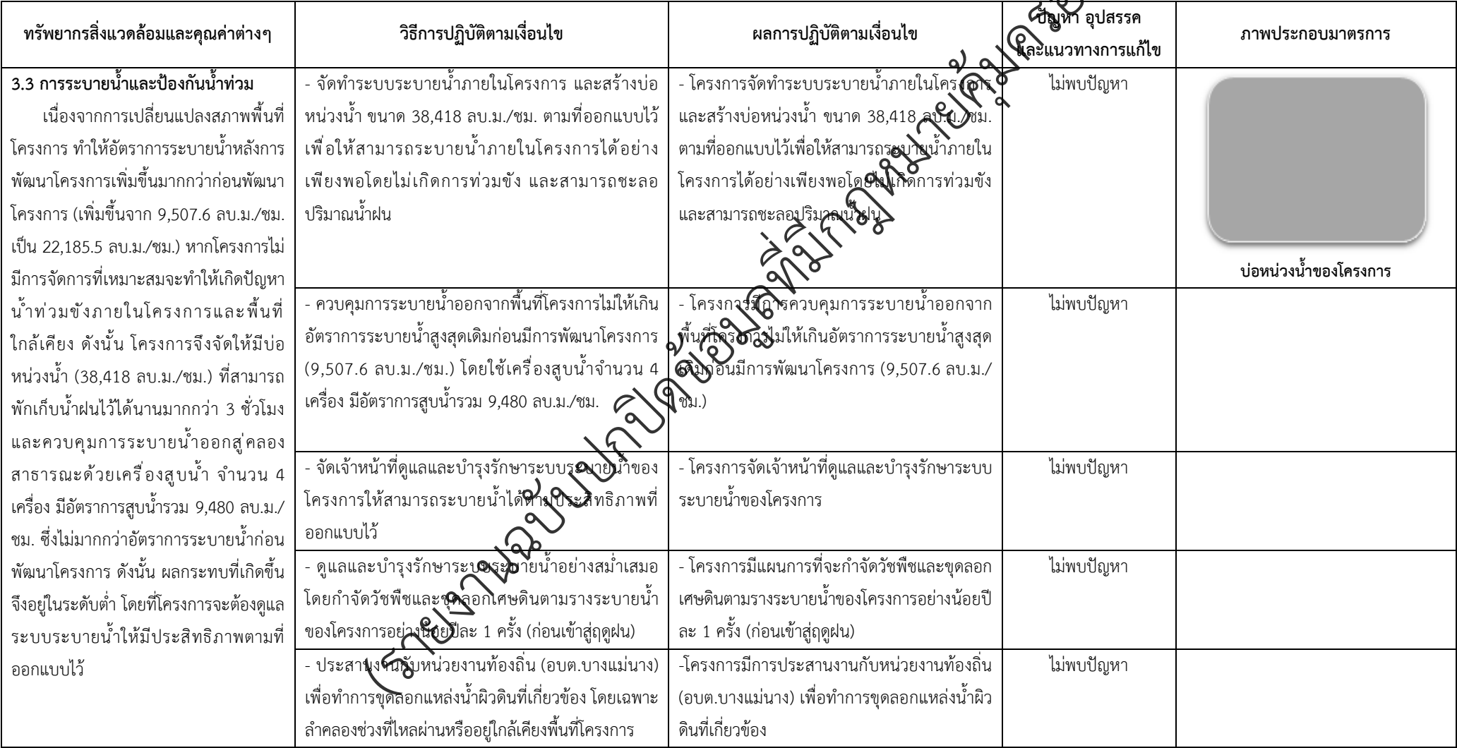
ตารางที่ 2-1 สรุปผลกระทบสิ่งแวดล้อมที่สำคัญและการปฏิบัติตามมาตรการป้องกันและแก้ไขผลกระทบสิ่งแวดล้อมและมาตรการติดตามตรวจสอบผลกระทบสิ่งแวดล้อม (ระยะดำเนินการ) โครงการเพอร์เฟค พาร์ค พระราม 5-บางใหญ่ ตั้งอยู่ที่ ตำบลบางแม่นาง อำเภอบางใหญ่ จังหวัดนนทบุรี (ต่อ)